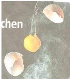
Ein gefährliches Geschoss auf dem Weg in die Schüssel des Staatsanwalts

Der Staatsanwalt unterstreicht mehrfach die hohe Qualifikation des Polizeizeugen, der sogar das unterschiedliche Flugverhalten eines Tischtennisballs und eines Eis vergleichen könne. Er selbst habe da eher Erfahrungen aus den Beobachtungen in der Küche. Ein rohes Ei berge in sich eine hohe Verletzungsgefahr. Zwar wolle er keine rechtsmedizinischen Pseudo Gutachten abgeben, aber das wisse jede Hausfrau, wie schwierig doch das Aufschlagen eines Eis am Schüsselrand beim Backen sei. Das erfordere Kraft. (Er schlägt pantomimisch ein imaginäres Ei an einer imaginären Schüssel auf!). Daran sehe man, wie hart die Schale ist, und wie weh es tut, wenn man so ein Ei abkriegt. Das sei vergleichbar mit einer Ohrfeige, und die sei auch Körperverletzung. „So einfach ist das!“