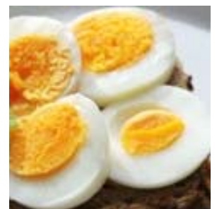
So sieht ein Freispruch aus

Nu singe mer in Frankford - von de Komik erschüddert: Kaa Pegida unn kei Bolizei had je e boil vom Ei am Ei